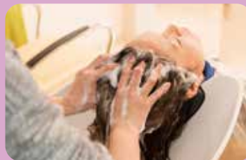
ツボを刺激し、むくみの原因となるリンパの 滞りを解消します。