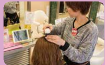
スパの後も「マイクロスコープ」でチェック! 頭皮もすっきり、見た目わかります。 お顔もリフトアップしましたね!