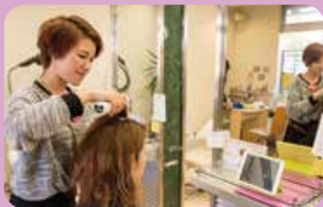
他では、なかなか取り入れていない 「マイクロスコープ」で頭皮と毛髪もチェック!