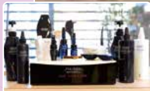
サロンならではのシステムトリートメント。 お家では美感できないツヤを!