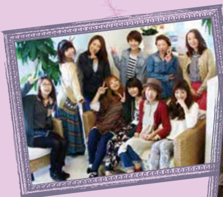
こだわりのお菓子と飲み物で、長時間の滞 在もカフェで過ごしている様にゆったりと。

美容室は、唯一自分の時間が取 れ、日頃の疲れを癒し、キレイになっ ていただくとおきの場所です。 身も心もリセットされ、モチベ