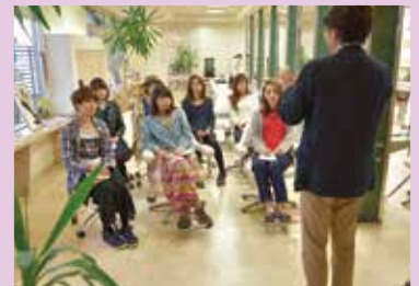
定期的に行われる営業前の勉強会。 日々、知識と技術を磨きます。

シオンアップに繋がります。 若作りではなく年齢を楽しんで ほしいので、ファムは大人の女性の 為の「キレイ」をトータルビューティ サポートして、エイジングライフを 素敵なものに導いていきたいと思 います。